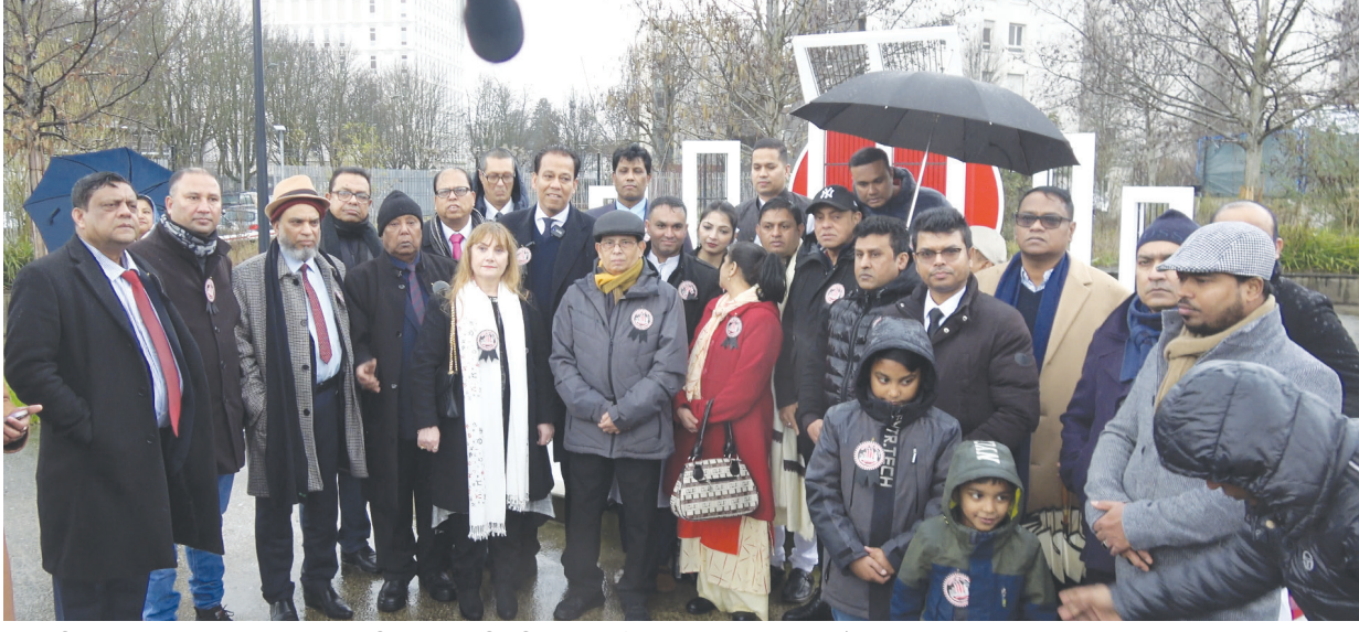
অবা শহীদদের প্রতি শ্রদ্ধা জানাতে ফ্রান্সের রাজধানী প্যারিসে স্থায়ী শহীদ মিনারে এই প্রথম পালিত হলো আন্তর্জাতিক মাতৃভাষা দিবস।