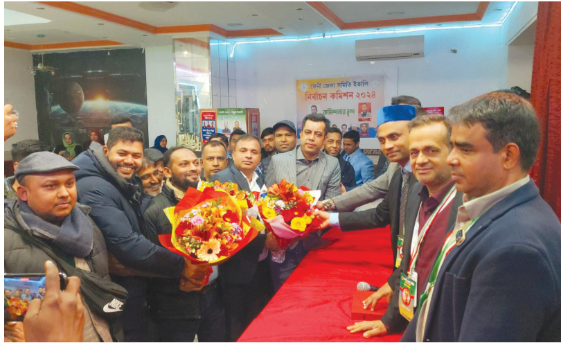
ফেনী জেলা সমিতি ইতালির নবনির্বাচিত নেতৃবৃন্দের ফুল দিয়ে শুভেচ্ছা জানানো হয়।

চলচ্চিত্রের মাধ্যমে তিনি আন্তর্জাতিক অঙ্গনে পরিচিতি পান। ‘লো কাপিতানো’ চলচ্চিত্রের অসাধারণ দৃশ্যগুলো ছাড়াও এতে একটা নিষ্ঠুর বাস্তবতা তুলে ধরা হয়েছে। অভিবাসীদের একটা বড় অংশ শিশু। তারা আফ্রিকা পাড়ি দিয়ে, ভূমধ্যসাগর পাড়ি দিয়ে ইউরোপে যাবার স্বপ্ন দেখে এবং ঝুঁকি নিয়ে তা পার হয়। ছবিতে ১৫ বছর বয়সি দুই ভাই পরিবারকে কিছু না বলে নিজেদের ভবিষ্যৎ বাজিয়ে দেখতে বেরিয়ে পড়ে। পরিচালক গারোনো ঠিক এমনই বাস্তবতা দেখেছেন সিসিলির কাটানিয়ায়। সেখানে একটি নৌকায় আড়াইশ’ অভিবাসীকে নিয়ে নৌকা চালিয়ে চলে আসে এক বালক, যার আগে কখনো নৌকা চালানোর অভিজ্ঞতাই ছিল না। “এই ঘটনা আমাকে তেমন আত্মতৃপ্তির গল্পের কথা মনে করিয়ে দেয়, যেমনটি লিখতেন স্টিভেনসন, জ্যাক লন্ডন বা কনরাদ,” বলেন গারোনো। “এই চলচ্চিত্রে সেটিই দেখানো হয়েছে। সেখানে এক দল তরুণ আছে, যারা স্বপ্ন পূরণের বের হয়ে পড়ে,” যোগ করেন এই পরিচালক।