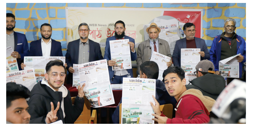
ওয়েব নিউজ টেলিভিশনের প্রিন্ট সংখ্যার পাঠ উন্মোচন করে প্রিন্ট সংখ্যার যাত্রা শুরু হয়।